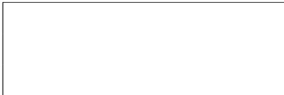
Схема границ эксплуатационной ответственности сторон

Прочие сведения по установлению границ раздела эксплуатационной ответственности сторон _____